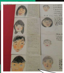
「ありがとう」は一人ひとりの似顔絵でできています