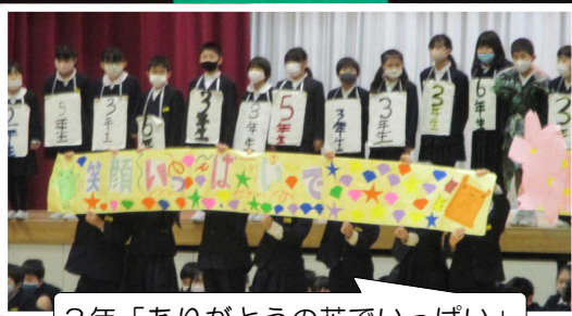
3年「ありがとうの花でいっぱい」