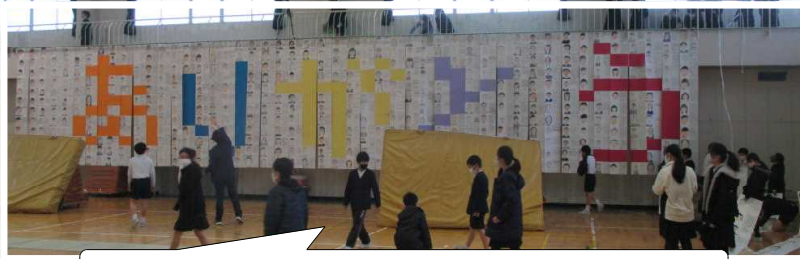
5年「司会進行・壁面飾り・放送での6年生紹介」