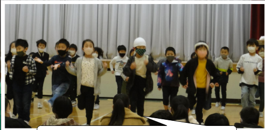
2年「この手でつかみたい夢」