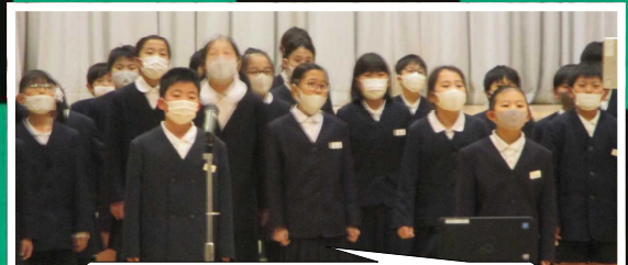
4年「エールをこめてTODAY」